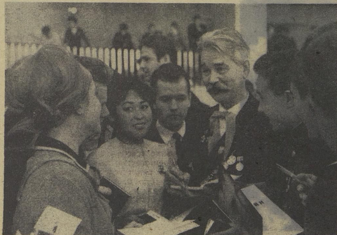
Здесь, на торжественном Пленуме, встречались комсомольцы разных поколений.

После доклада Первого секретаря ЦК ВЛКСМ Е. М. Тяжельникова о пятидесятилетии Всесоюзного Ленинского Коммунистического Союза Молодёжи выступили с приветствиями представители всех поколений комсомола — его живая история.