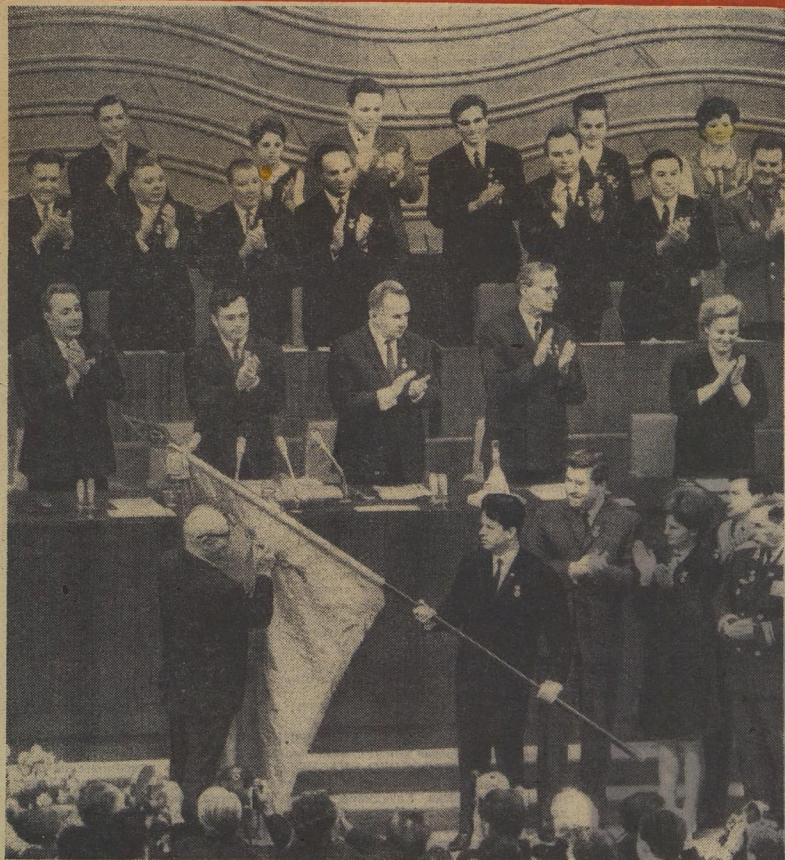
Председатель Президиума Верховного Совета СССР Николай Викторович Подгорный прикрепляет орден Октябрьской Революции к знамению Ленинского комсомола.