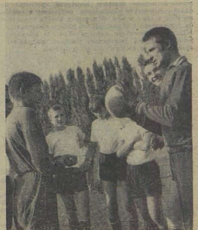
С утра до вечера, разбивая колени и башмаки, нападали нападающие, защищали защитники, стояли вратари в воротах между двумя камнями... Ни тебе поля футбольного, ни команды.